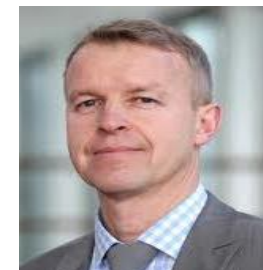
赛威传动 业务部门主管