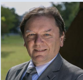
柏林自由大学市场学系主任