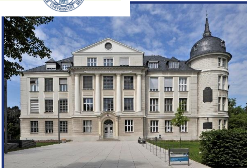
柏林自由大学 德国