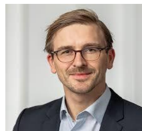
柏林自由大学商业信息学博士后