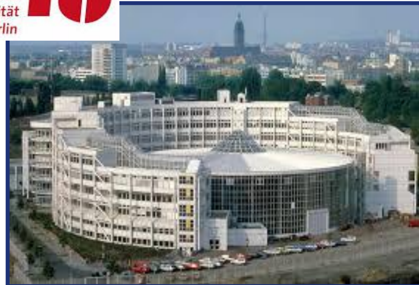
柏林工业大学 德国