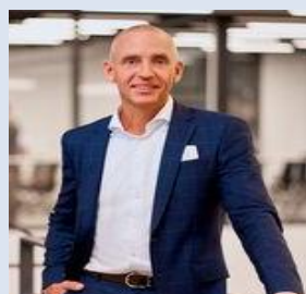
博世力士乐(Bosch Rexroth)自动化工厂 销售副总裁