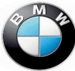
宝马 车厂摩托车制造线