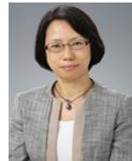
日本recruit社工作30年，历任人事部、 企业培训、人材与能力发展、市场发展，