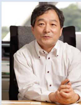
日本中央大学教授