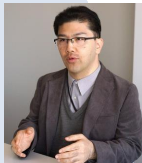
明治大学副教授、日本建筑学者、 现代日本文化研究者