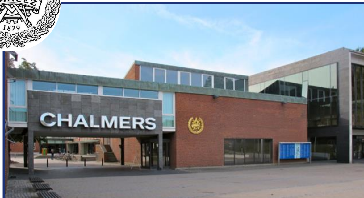
查尔姆斯理工大学