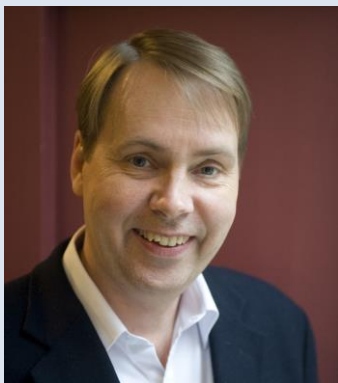
瑞典皇家工程科学院院士 查尔姆斯理工大学技术管理和经济学教授