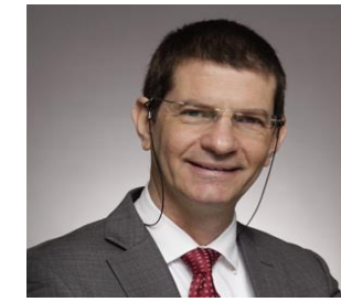
特拉维夫大学管理学系教授