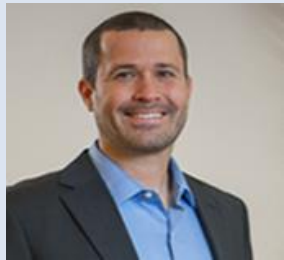
教育家、政治家、 “米兹拉希运动”副主任