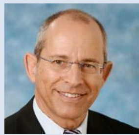
特拉维夫大学商学院院 长