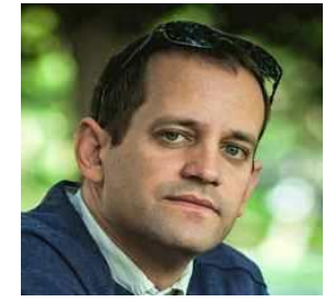
特拉维夫大学管理学系教授