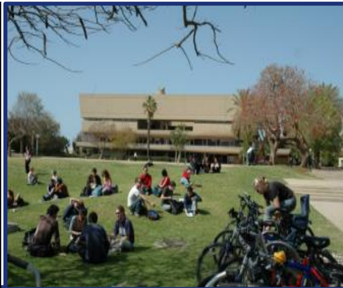
特拉维夫大学 以色列