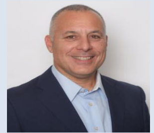
以色列知名风险投资公司 Benhamou Global Ventures 合伙人、 BBA Investments 合伙人