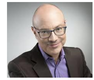
Fresh Blue Ltd. 的常务董事、特拉 维夫大学商学院创业与创新科技 讲师