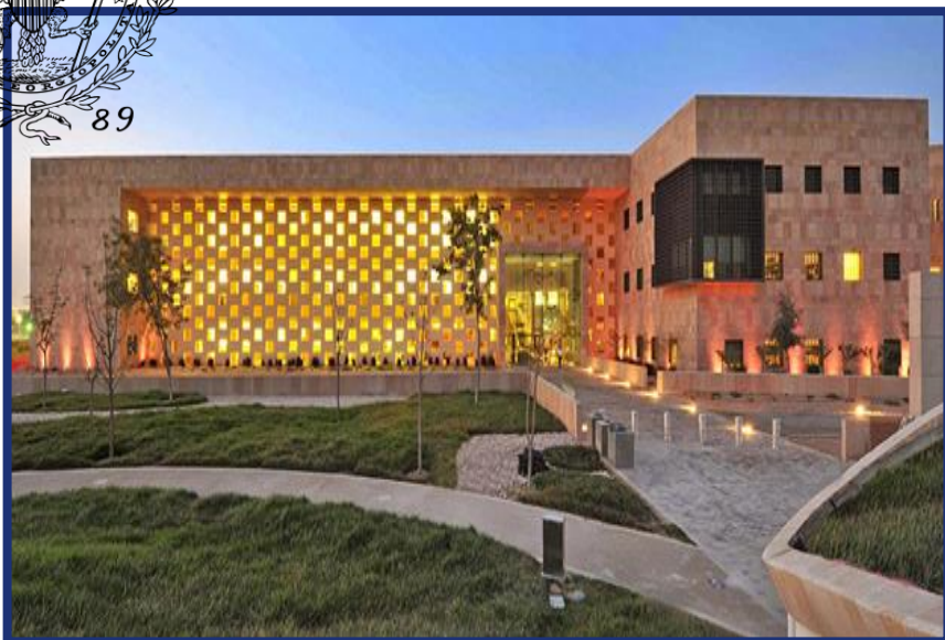
乔治城大学卡塔尔分校 卡塔尔