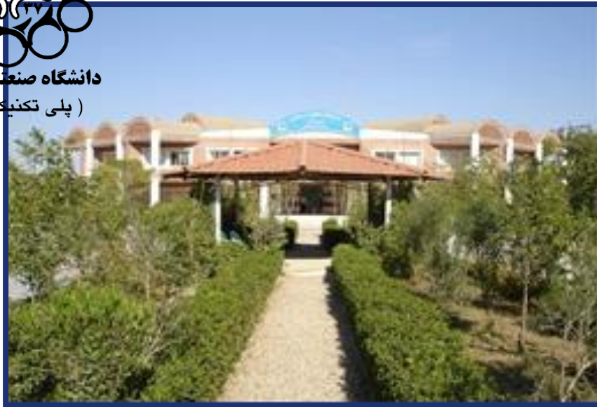
阿米尔卡比尔理工大学 伊朗