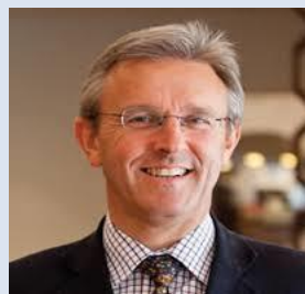
乔治城大学卡塔尔外交 学院国际关系与海湾 研究教授