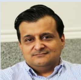
阿米尔卡比尔理工大学助理教授