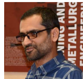
中国南开大学政治学博士后、 德黑兰Shahid Beheshti大学助理 教授