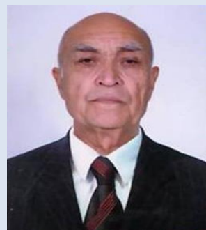
乌兹别克斯坦国立大学考古学系 教授