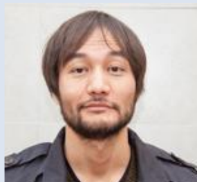
KIMEP大学助理教授、 「中国和中亚研究中心」副主任