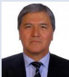
乌兹别克斯坦国立大学经济学教授 「宏观经济学系」主任