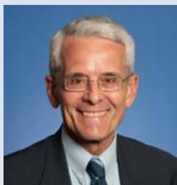
乔治华盛顿大学教授、 前美国政府亚太关系资深研究员