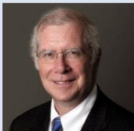
华盛顿中国投资中心总裁