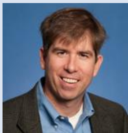
乔治华盛顿大学教授、 奥巴马总统三位经济顾问 委员会成员之一