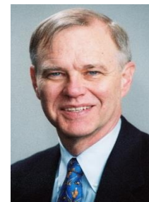
布鲁金斯学会东亚政策 研究中心主任、 曾任美国在台协会理事 主席