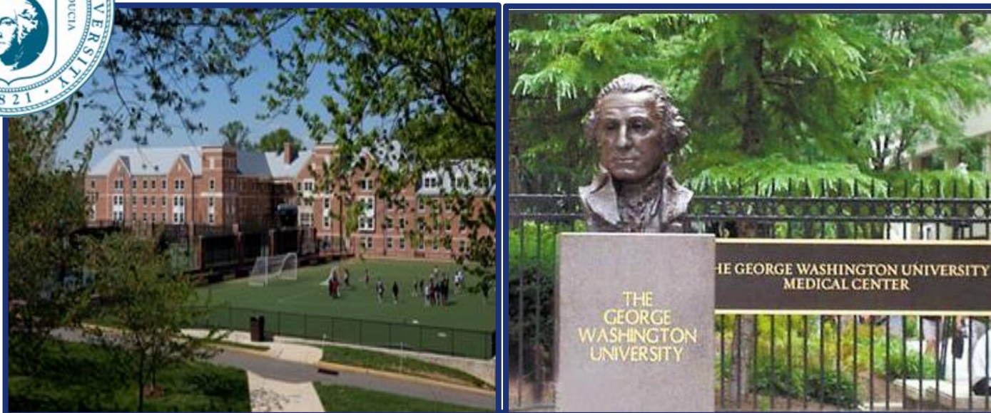
乔治华盛顿大学 美国