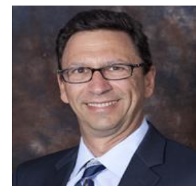
乔治华盛顿大学媒体与公共事务学院院长、 艾美奖资深传媒人、 CNN知名主持人及白宫记者